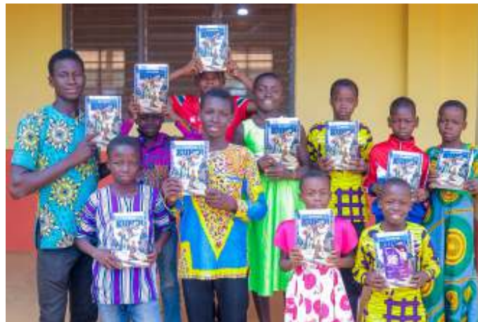
Kinderen in Ghana met bijbel in Dagbani

Door klimaatverandering valt de regen in het hoge Andesgebergte steeds grilliger. Veel jongeren trekken naar de stad omdat ze geen toekomst zien in de bergen. Maar sinds er waterreservoirs zijn kunnen boeren en boerinnen hun land irrigeren. Ze leren inheemse groenterassen weer waarderen en biologisch verbouwen en gaan samenwerken in coöperaties. En jongeren keren weer terug. Stadsbewoners leren stadslandbouw en scholieren gaan aan de slag in schooltuinen. Het geeft hoop dat zelfs op 4.000 meter hoogte landbouw mogelijk is.