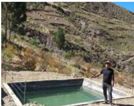
Waterreservoirs maken irrigatie mogelijk

Door klimaatverandering valt de regen in het hoge Andesgebergte steeds grilliger. Veel jongeren trekken naar de stad omdat ze geen toekomst zien in de bergen. Maar sinds er waterreservoirs zijn kunnen boeren en boerinnen hun land irrigeren. Ze leren inheemse groenterassen weer waarderen en biologisch verbouwen en gaan samenwerken in coöperaties. En jongeren keren weer terug. Stadsbewoners leren stadslandbouw en scholieren gaan aan de slag in schooltuinen. Het geeft hoop dat zelfs op 4.000 meter hoogte landbouw mogelijk is.