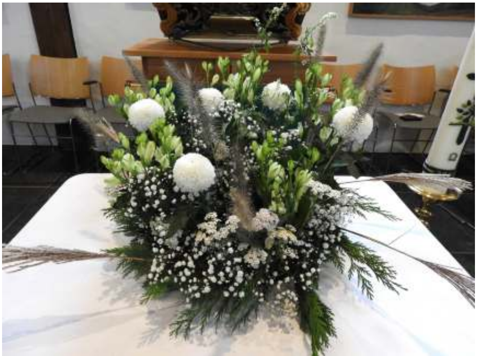
Liturgisch boeket startdienst, gemaakt door Cora Noort