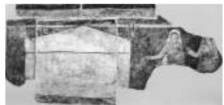
Een muurschildering in Syrië uit 250 na Christus. De verbeelding van de vrouwen aan het graf is de oudst bekende voorstelling van Pasen die in alle tradities is gebleven.

Dat is taal en beeld van Paasgeloof van eeuwen en eeuwen her tot op vandaag