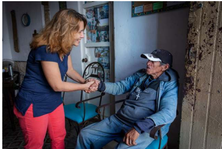
Collecte voor de gaarkeukens in Cuba. Niet alleen voedsel voor de maag maar ook voor de ziel: Een stuk zorg en aandacht.