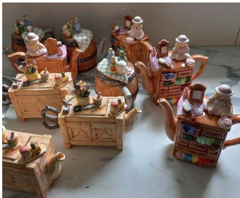
Werkgroep Oudercontact: High tea