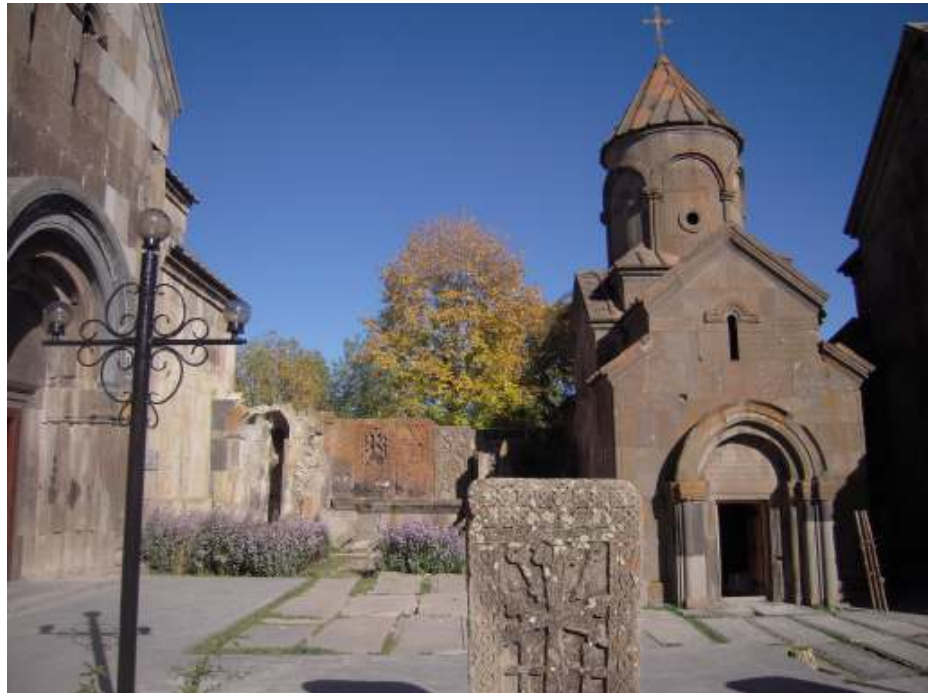
Collecte 27 oktober: St. Asmik in Armenië