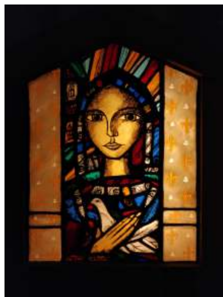
Reims kathedraal Jeanne d'Arc