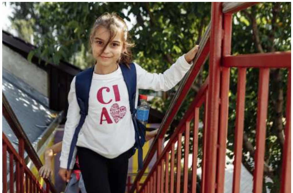
Collecte op 1 december voor Moldavië